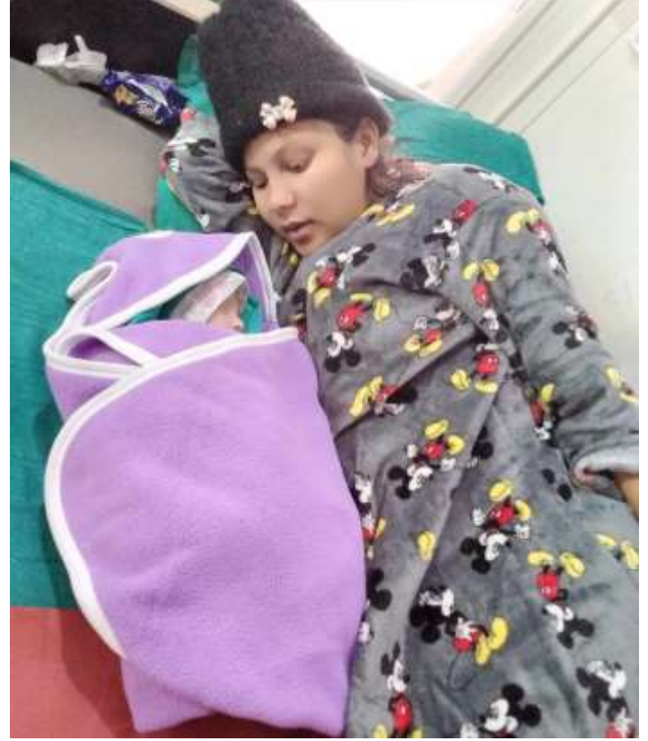
२०८०/०८/०८ गते साँझका दुई सुत्केरीआमाहरू र नवशिशुहरू @ छोप्राक स्वास्थ्य चौकी, गोरखा