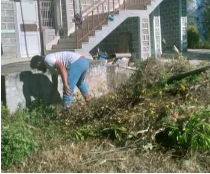
सरसफाई @ राखु भगवती स्वास्थ्य चौकी, म्याग्दी

गण्डकी प्रदेश सरकार सामाजिक विकास तथा स्वास्थ्य मन्त्रालय स्वास्थ्य निर्देशनालय पोखरा, नेपाल